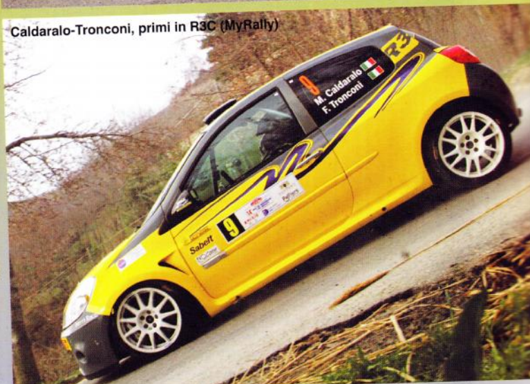
Caldaralo-Tronconi, primi in R3C (MyRally)